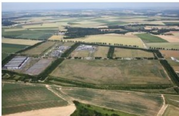
Figure 31 : Vue aérienne du parc d'activité du Plateau